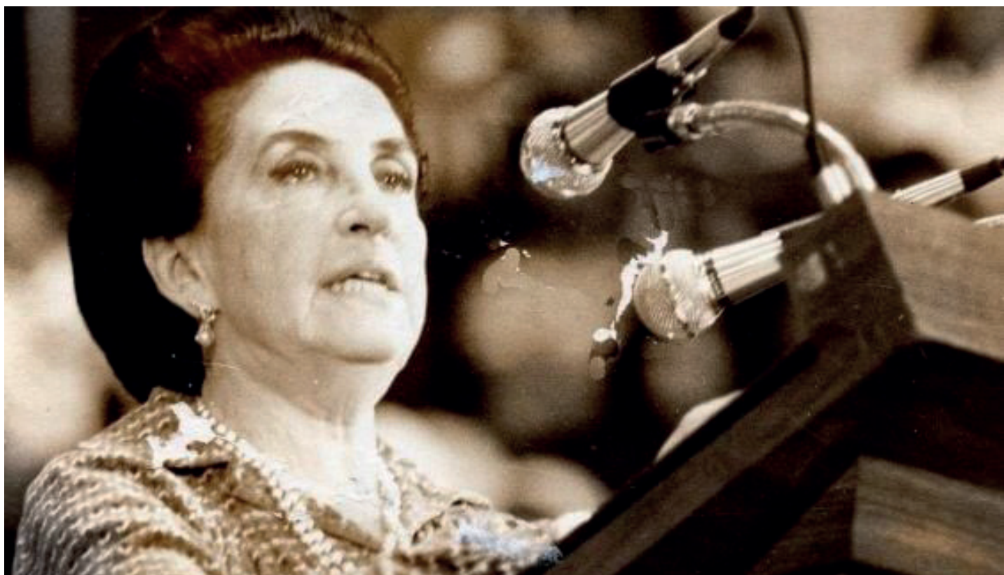
Gobernadora Griselda Álvarez.

En resumen, las mujeres han sostenido una lucha constante pese a la dificultad del proceso en los últimos dos siglos, en los que han ganado derechos, participación, representación y cargos de jerarquía. El trabajo político de mujeres como Griselda Álvarez y de otras más son ejemplo a seguir para tener una sociedad más justa y equitativa. Las mujeres han ocupado las primeras posiciones en la impartición de la justicia, en partidos políticos, sindicatos, organizaciones, universidades, en gobiernos estatales y municipales, y muy probablemente en el federal en este año. Las mujeres dan la esperanza de ir hacia un futuro prometedor.