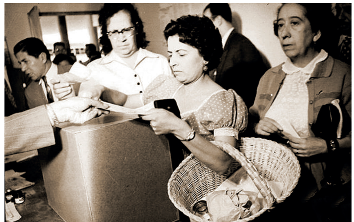
Mujeres votando en México por primera vez.

La gobernadora reconoció la trascendencia del derecho al voto para las mujeres, pero subrayó sus limitantes para ejercer sus derechos debido a prejuicios, a las ausencias de poder e influencia y a su baja participación en organizaciones, movimientos y partidos. 3 Lamentó que el problema del crecimiento poblacional a consecuencia de que el sistema las había dejado como reproductoras.